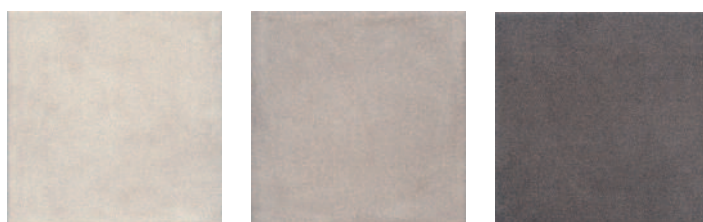
1570 Карнаби-стрит беж светлый 20x20 Carnaby Street light beige