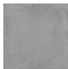
1574 Карнаби-стрит серый 20x20 Carnaby Street grey