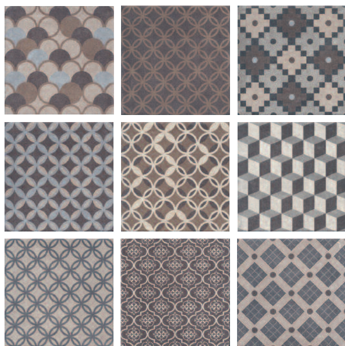
1577* Карнаби-стрит орнамент 20x20 Carnaby Street pattern