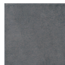
1572 Карнаби-стрит серый темный 20x20 Carnaby Street dark grey