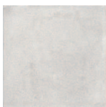
1573 Карнаби-стрит серый светлый 20x20 Carnaby Street light grey