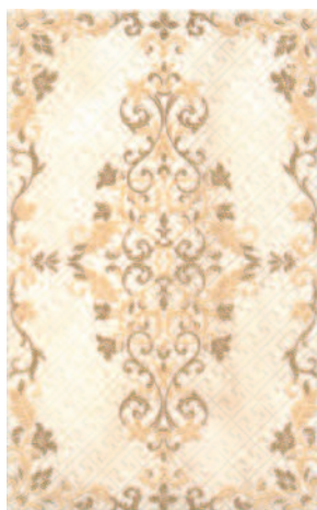
DT/A94/6249 Сомерсет 25x40 Somerset