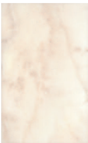
6249 Сомерсет беж 25x40 Somerset beige