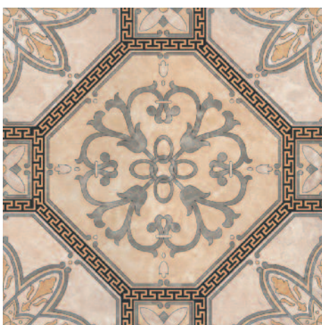
4224 Сомерсет 40,2x40,2 Somerset