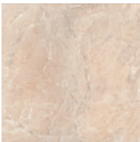
4220 Сомерсет беж темный 40,2x40,2 Somerset dark beige