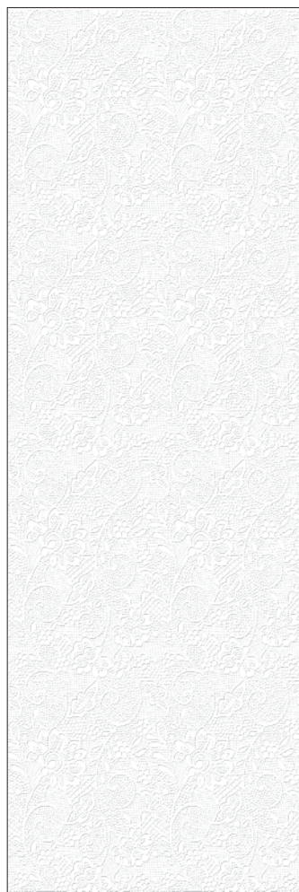
13009R Сент-Джеймс парк Кружево обрезной 30x89,5 St. James Park Lace rectified