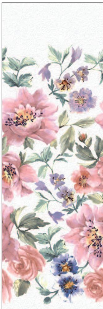
13008R Сент-Джеймс парк Цветы обрезной 30x89,5 St. James Park Flowers rectified