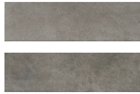
2911 Маттоне серый 8,5x28,5 Mattone grey