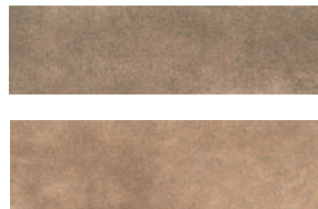
2907 Маттоне беж 8,5x28,5 Mattone beige